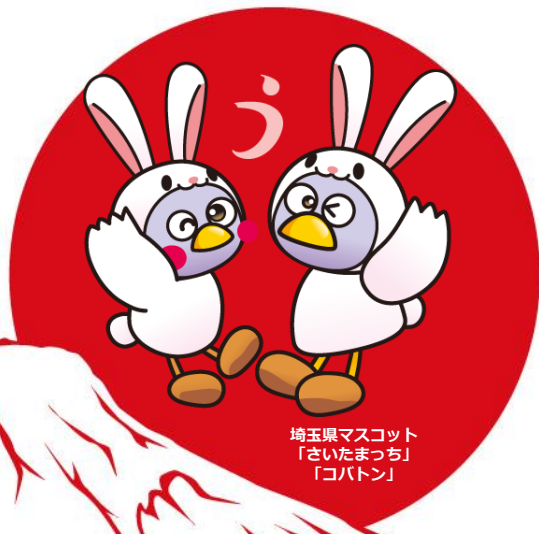
埼玉県マスコット 「さいたまっち」 「コバトン」