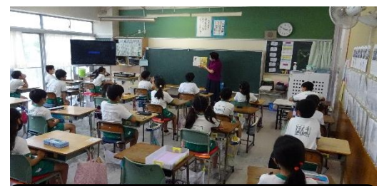
読み聞かせボランティア(1~3年)