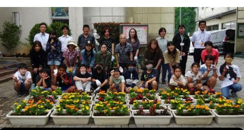
花植えボランティア(環境委員会)