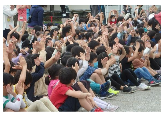
50周年記念行事 バルーンリリース集会